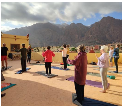
Séance de Yoga en extérieur