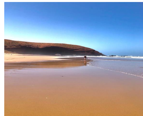
Plage de Mirleft

Enseignante de Yoga diplômée de l'Efymp formée au Yoga du Son à l'institut des Arts de la voix, Patrick Torre